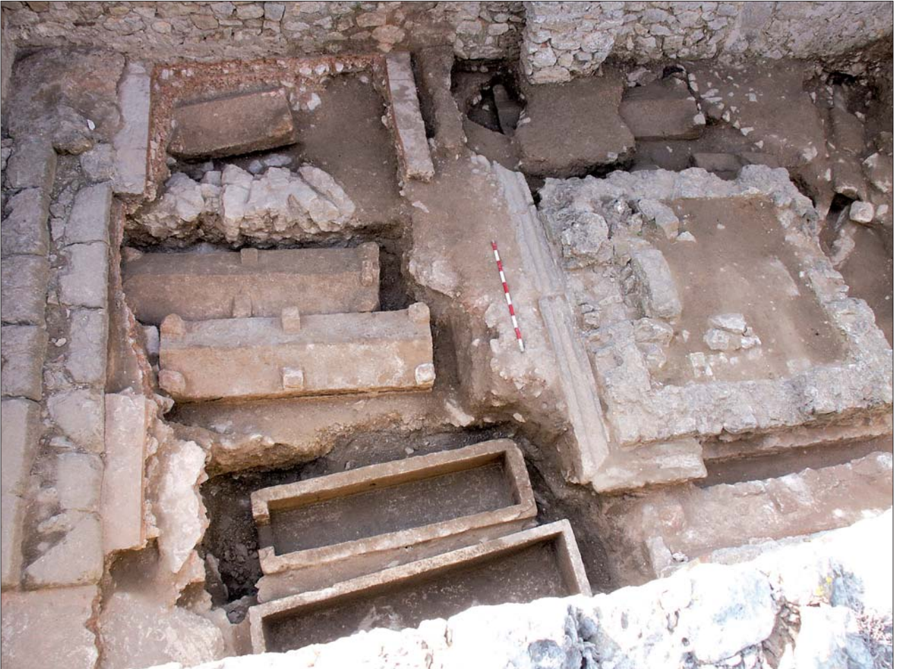
Fig. 2. Vista general de l'excavació de l'església de Santa Margarida (L'Escalade-Empúries), amb les restes del baptisteri i les tombes localitzades al seu interior.