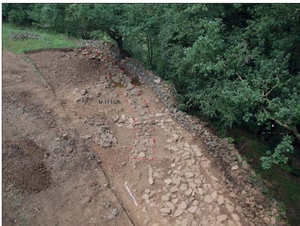
Fig. 4. Vista en planta de l'estructura semicircular localitzada a la cala nord-est