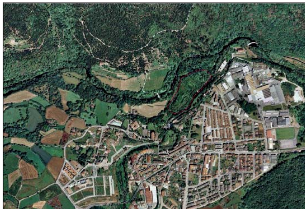
Fig. 1. Ubicació del puig del Boscarró

El jaciment del Boscarró es troba situat al costat nord-oest del municipi, al cim d'una cinglera ben coneguda per la colada basàltica que s'hi troba. El turó sobre el qual s'han trobat les restes arqueològiques, d'unes dues hectàrees de superfície, queda envoltat al nord/nord-oest per la riera de Bianya i al sud/sud-est pel riu Fluvià. Aquest cim, que esdevé una plataforma irregular, allargada i orientada en sentit SW/NE, força plana i amb desnivell cap al NE, es troba a unes cotes d'alçada entre 337,3 i 336,1 m s.n.m. (Fig. 1.)