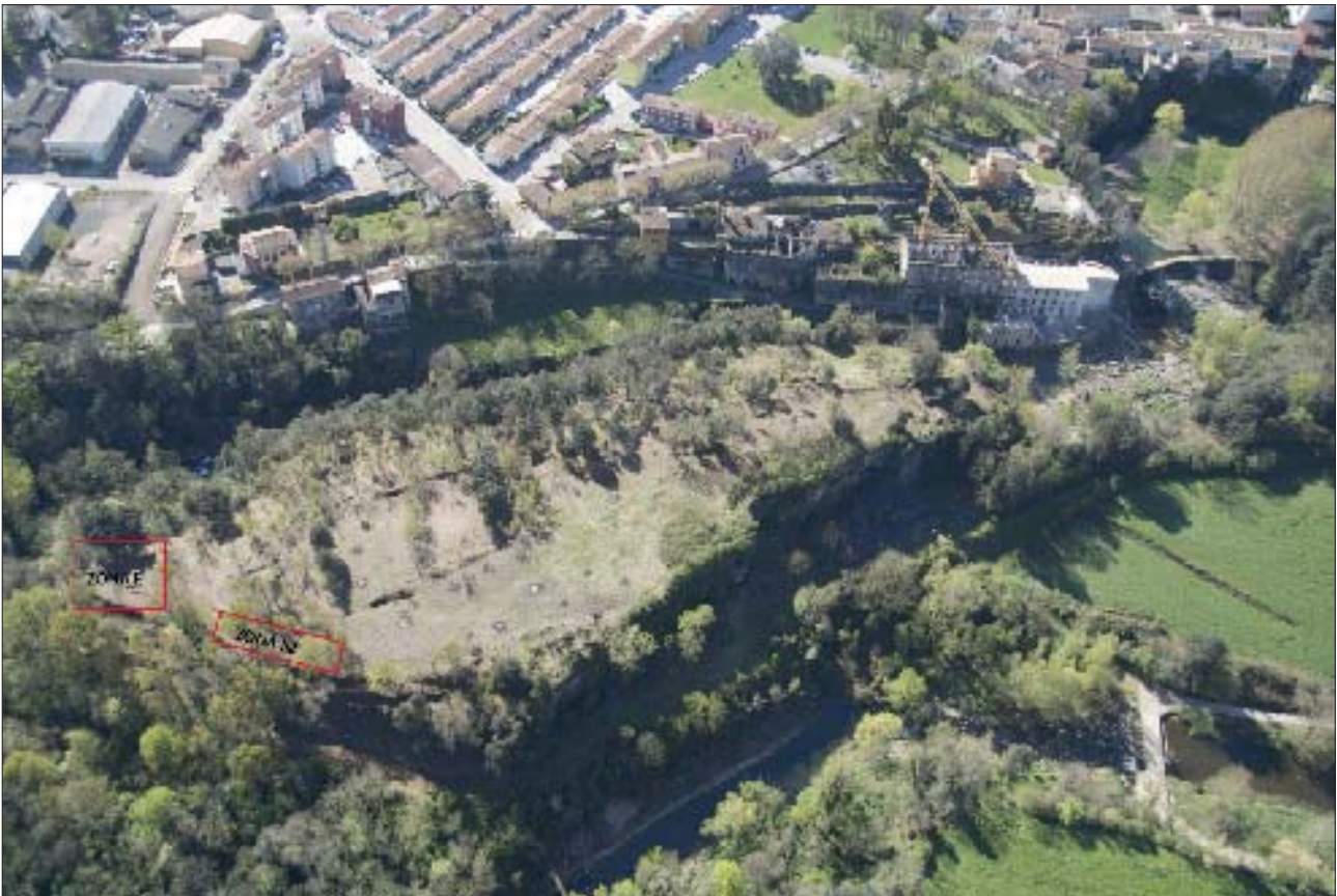
Fig. 3. Ubicació de les zones excavades durant les campanyes dels mesos d'abril i juliol de 2014

mera tasca fou reprendre l'excavació del nivell d'amortització de les restes del poblat. La unitat contenia un conjunt molt important de materials arqueològics, entre els quals destaquen 54 fragments de ceràmica realitzada a mà, 90 de ceràmica comuna ibèrica, 44 informes d'àmfora ibèrica i 2 fragments d'una importació fins ara inexistents a l'inventari ceràmic del jaciment del Boscarró: àmfora massaliota. Aquest cobria un seguit de noves estructures que completaven l'entramat de la zona excavada a l'anterior campanya: els murs de les UE's 1038, 1039, 1040 i 1042 i el nivell d'enderroc UE 1041. Les unitats UE 1038 i UE 1040 corresponen a dos trams més del mur ja localitzat l'anterior campanya i registrat sota el nom de UE 1026 (Fig. 4). Es tracta d'un gran mur que discorre de manera semicircular (sembla marcar un perímetre) amb una orientació nord-oest/sud-est que mesura en total uns 8 m de llargària i presenta una amplada regular