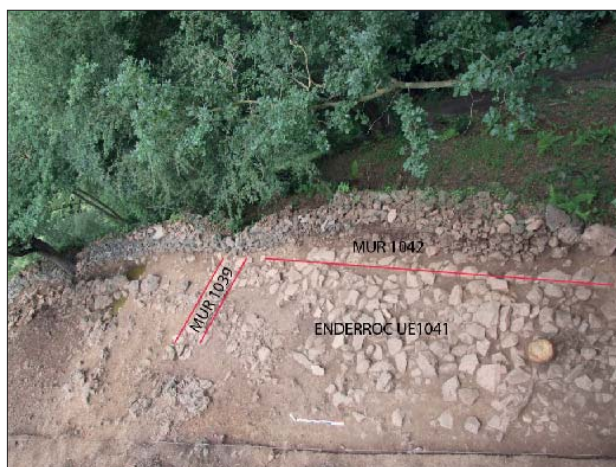
Fig. 5. Vista de l'estança documentada a nivell d'enderroc