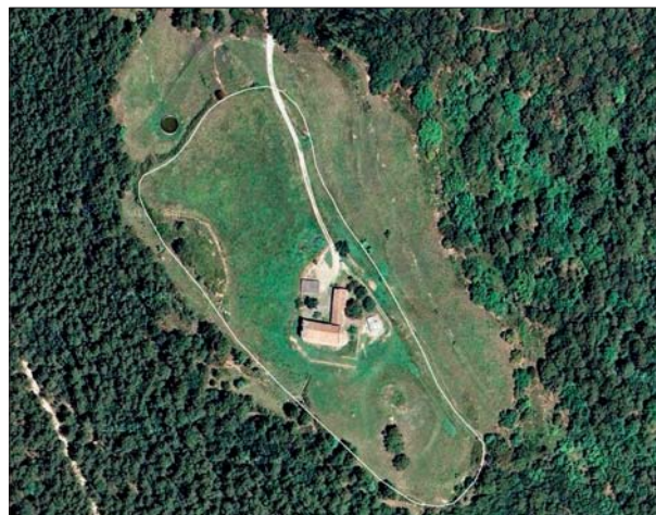
Fig. 1. Vista aèria de l'emplaçament del jaciment, amb el perímetre de l'esplanada al centre de la qual hi ha l'ermita de Santa Magdalena

Els treballs d'arranjament de l'esplanada al voltant de l'ermita de Santa Magdalena, dita de Jonqueres, portats a terme pel propietari de lloc, varen fer emergir en superfície una quantitat prou notable de fragments ceràmics que va alertar sobre una possible afectació del jaciment que se suposa hi ha en el lloc, del qual es tenen notícies de la seva existència almenys des de mitjan anys 60 del segle passat, malgrat no s'hi hagi portat mai a terme cap excavació arqueològica. El jaciment es troba al cim del puig de Santa Magdalena, nom que li ve per l'ermita construïda al bell mig del planell superior, elevació que forma part dels estreps sud-orientals del massís de la Marededéu del Mont. Al costat nord té adossat un mas i les esplanades del voltant fins fa ben poc havien estat camps de conreu, ara convertits en prats i pastures. Tota