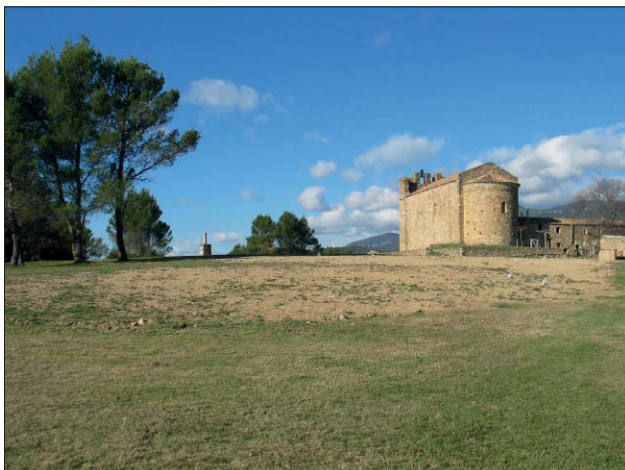
Fig. 2. Vista general, des del SE, del camp que va proporcionar el major nombre de materials arqueològics en la campanya de prospecció de l'any 2012.

terpretació dels materials ceràmics recuperats superficialment. En cap de les dues zones on es va treballar es feren evidents restes constructives que haurien certificat la presència d'un hàbitat 4 .