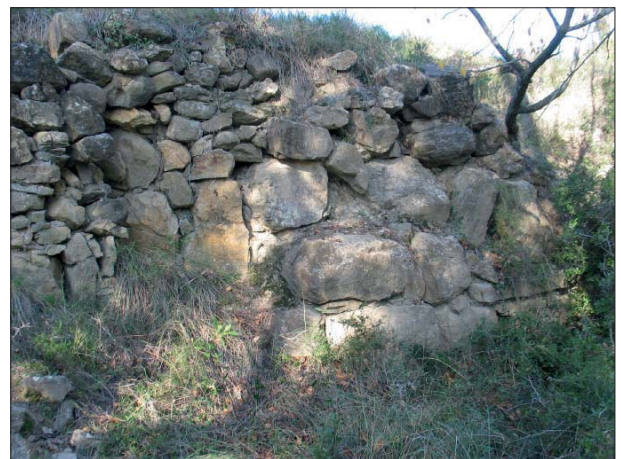
Fig. 4. Fragment de parament localitzat en el límit SE de la terrassa superior, en el que es veu la construcció de grans pedres, suposadament de la muralla original, alterada per reformes posteriors, fetes amb pedres de menor format.

llor encaixades i ben col·locades (fig. 4). En el perímetre entre la primera i la