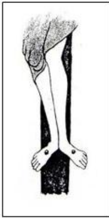
Fig. 1. En rotació externa amb un dels Claus fora de la creu.