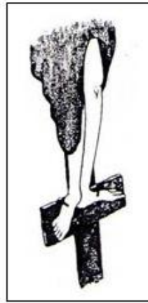
Fig. 3. Col·locant un supedani ample con un altre travesser de la creu.