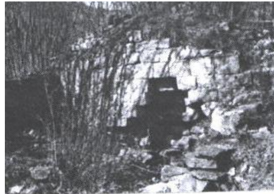
Restes dels carreus i murs de Sant Antoni de Collfred