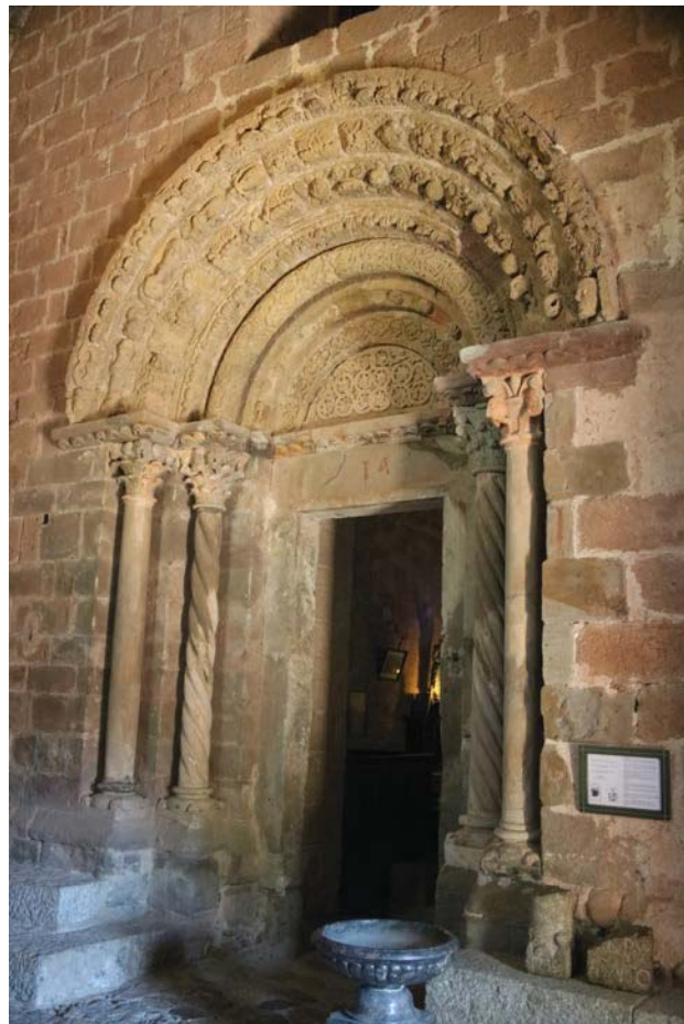
Fig. 10. Portalada de Santa Maria de Costoja

Tradicionalment, la historiografia ha subratllat la dependència de l'escultura de el portal de Lladó respecte a l'escultura de Santa Maria de Costoja (fig.10), al Vallespir, consagrada l'any 1142. El cert és que la parentela és especialment palpable en l'articulació de la portalada (amb arquivoltes profusament decorades amb fulles d'acant i altres motius vegetals), així com en el repertori decoratiu dels capitells. Malgrat algunes coincidències de repertori, també s'aprecien algunes diferències entre Lladó i Costoja (on trobem una major profusió decorativa i de repertori) que ens porten a atribuir tals vinculacions a la transmissió de repertoris de models i, en tot cas, a la superfície d'interacció que van compartir en un espai estilístic força homogeni.