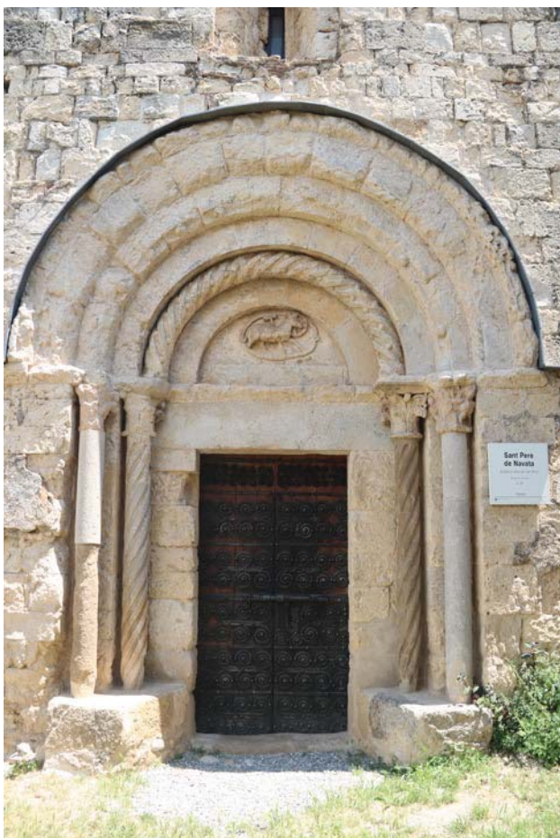
Fig. 7. Portalada de Sant Pere de Navata

Els capitells de la portada, derivats del corinti, presenten decoració en tres nivells: dos de fulles d'acant i un tercer amb un motiu floral i volutes (fig.9). Aquest tipus de decoració, de clara empremta antiquitzant, apareix de forma recurrent en diversos conjunts situats a l'antic comtat de Besalú, concretament a les portades de Sant Joan les Fonts, Santa Maria de Cistella, Sant Pere de Navata, Santa Maria de Costoja i a l'hospital de Sant Julià de Besalú. El capitell interior del brancal esquerre del portal presenta una lleugera variació respecte de la resta. Tot i que repeteix el model derivat del corinti amb tres nivells de fulles, la seva superfície rep un tractament a base de palmes.