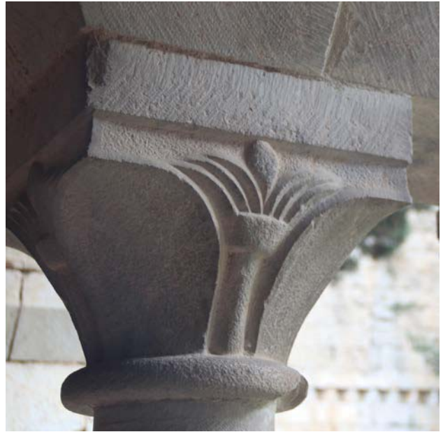
Fig.18.Capitell del claustre de Santa Maria de Vilabertran