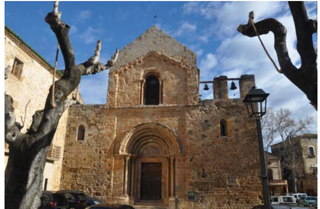
Fig. 5. Vista general de la façana occidental

La coberta de la nau central es resol mitjançant una volta apuntada reforçada amb tres arcs torals, també apuntats, que arrenquen de semi-columnes adossades als pilars que suporten els arcs formers. Les naus laterals són cobertes amb voltes de quart de cercle, i només tenen un arc toral, de mig punt, sobre pilastres rectangulars, vers l'extrem occidental.