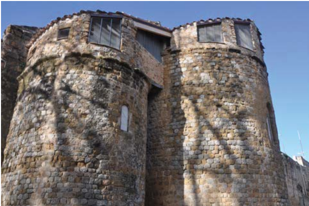
Fig. 4. Vista general de la capçalera