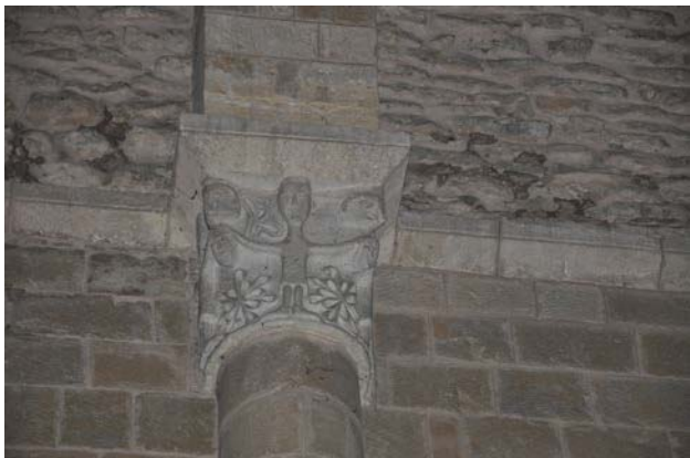
Fig. 2. Capitel·l amb escena figurativa