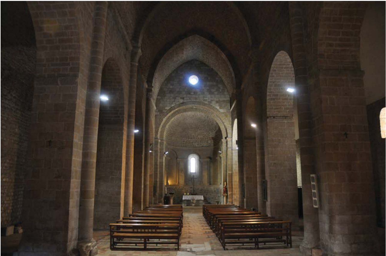
Fig.1. Vista general de l'interior de l'església

hagué un hospital situat a pocs metres a ponent de la portada d'accés al monestir, els murs del qual encara es conserven 17 .