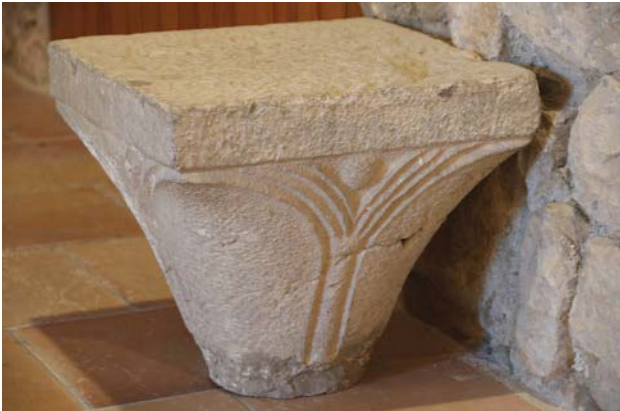
Fig.17.Capitell procedent del claustre, avui conservat a les dependències de la canònica