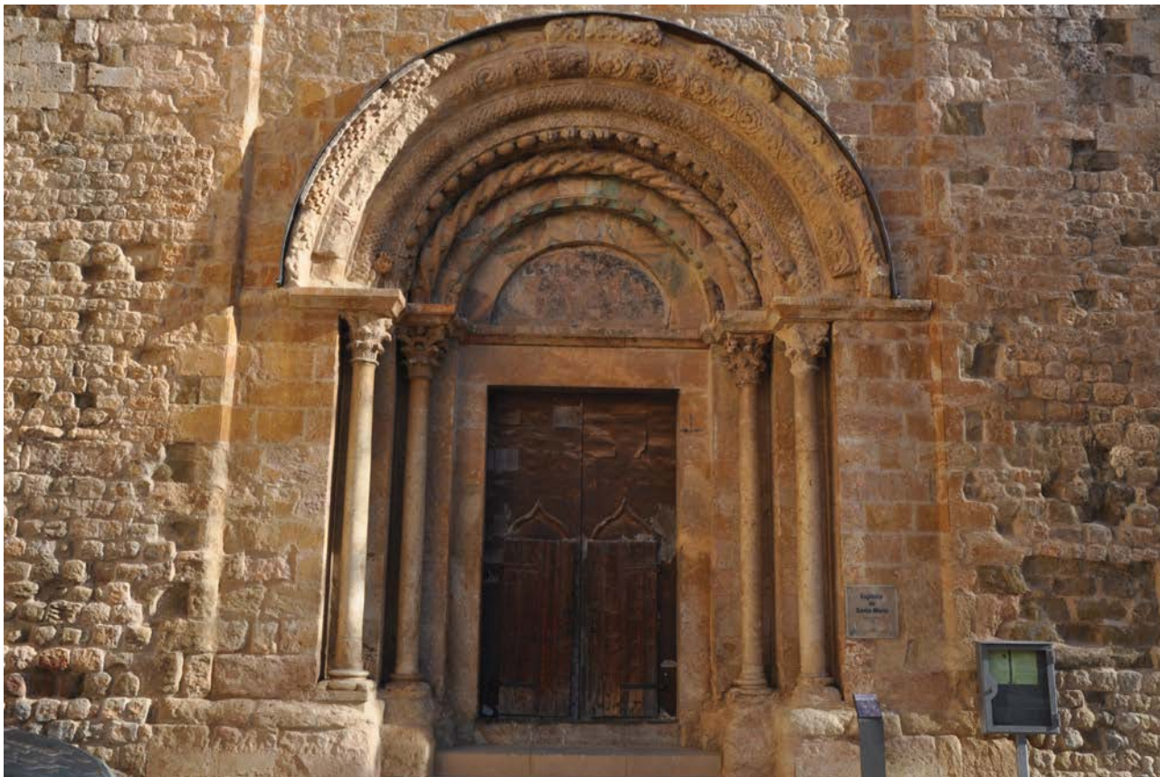
Fig. 6. Vista general de la portalada

vestigis de dues torres que no es van arribar a edificar. Cal pensar que només es va executar una part del primer pis de la torre meridional, amb dos grans finestrals inacabats i coronats posteriorment com a campanar. La façana havia de ser per tant simètrica, amb un cloquer a cada extrem.