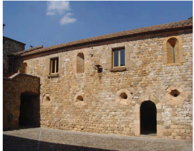
Fig. 12. Dependències de l'antiga canònica augustiniana

D'altra banda, els capitells de Lladó segueixen el model d'alguns capitells de la nau central del veí monestir de Sant Pere de Rodes, que també presenten una estructura derivada del corinti amb dos nivells de fulles d'acant i un tercer corresponent a les volutes. En aquest sentit, cal pensar que probablement Rodes es va convertir en un focus d'irradiació i important centre de referència per a conjunts erigits en el territori de l'antic comtat de Besalú durant la segona meitat de segle XII, com és el cas de Lladó i Cistella. Pel que fa a la cronologia del temple, si admetem les relacions de la portalada amb l'escultura de Costoja i les experiències rosselloneses, sembla improbable que la portalada i la fàbrica fossin construïdes abans de 1150. Aquesta data es postula favorablement com a límit inferior o post quem per a les obres del temple, que es van poder perllongar fins als últims anys del mandat del prior Arnau de Coll (1136-1196), el principal promotor de la construcció.