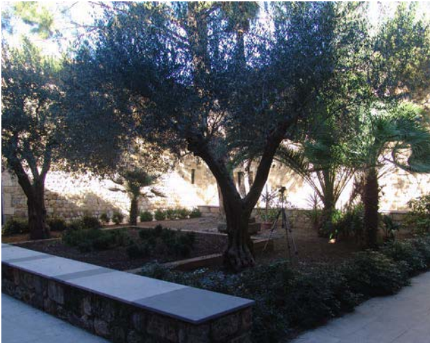
Fig. 11. Pati central del claustre