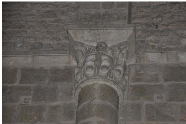
Fig. 3. Capitel·l amb escena figurativa